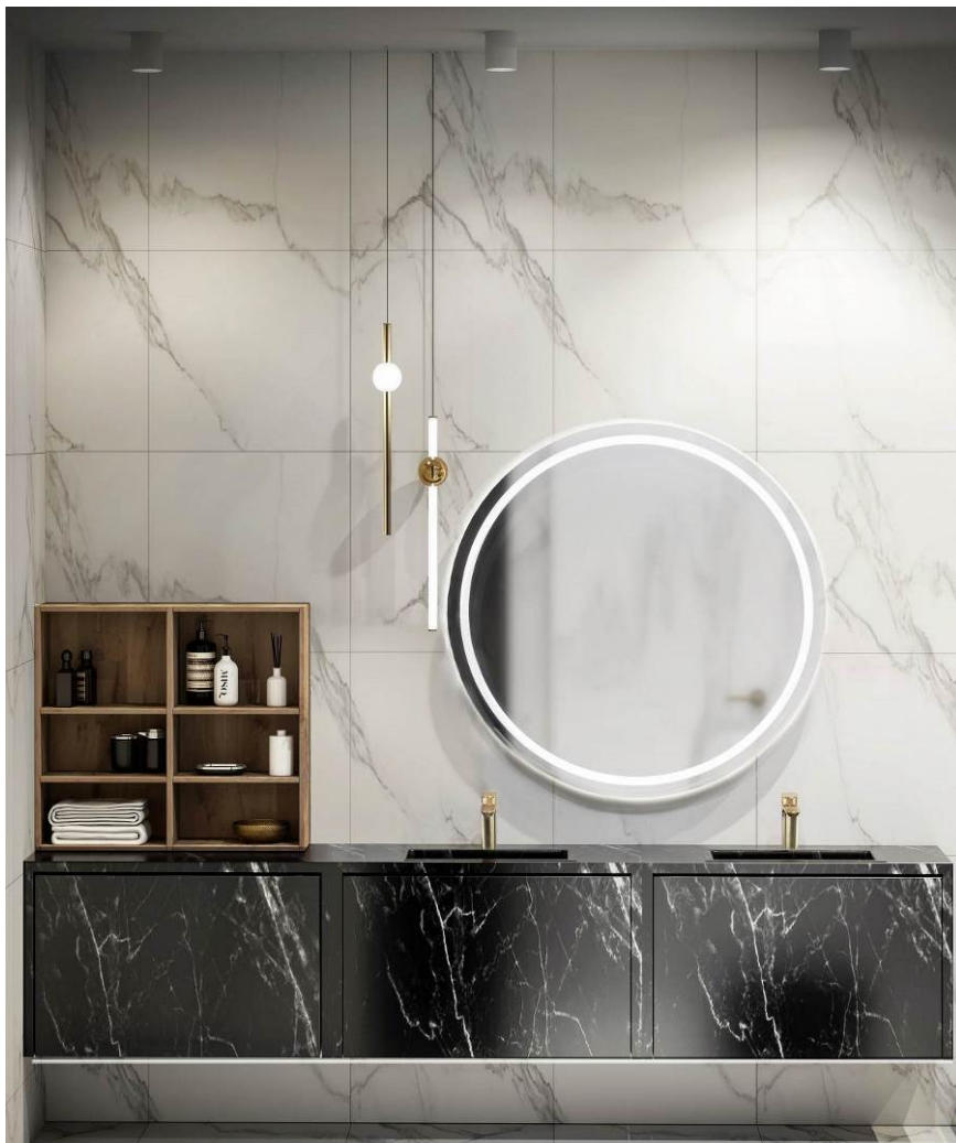
Foto: Proyecto 'Entre Cielo y Tierra', de Marina Shahrai. Zona de lavabo con grifería de la colección Alexia de Ramon Soler® en acabado oro cepillado.

Por un lado, la zona de lavabo, con dos lavabos empotrados en un mueble de acabado efecto mármol negro y blanco, que representa la característica de lo tangible, lo terrenal. Le acompaña un gran espejo redondo con iluminación LED, y un mueble superior en madera oscura complementa el almacenaje oculto en el mueble de baño, para una mayor comodidad en el día a día.