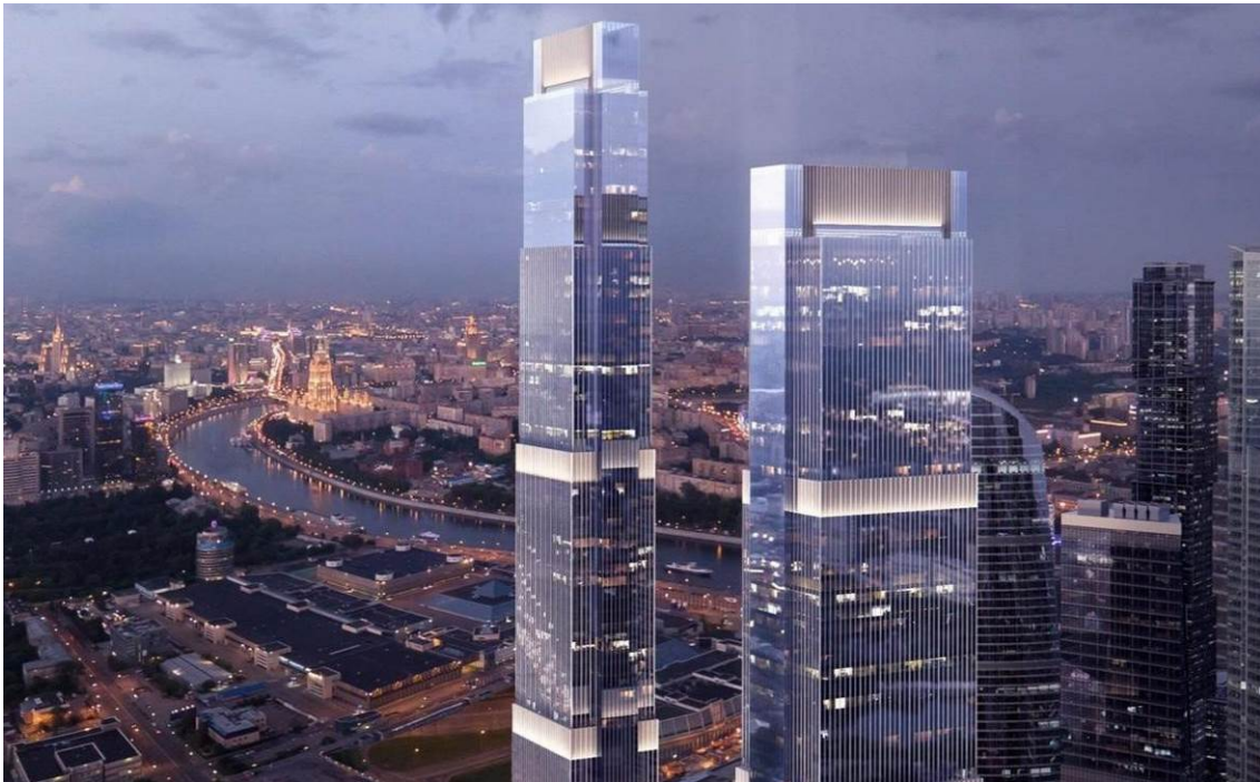
Foto: edificio Neva Towers en Moscow City

El edificio Neva Towers es la representación de la arquitectura moderna, una que no entiende de modas efímeras , sino que se sustenta en su sobria e imponente belleza, gracias a la ligereza del vidrio y la piedra natural de toda su estructura.